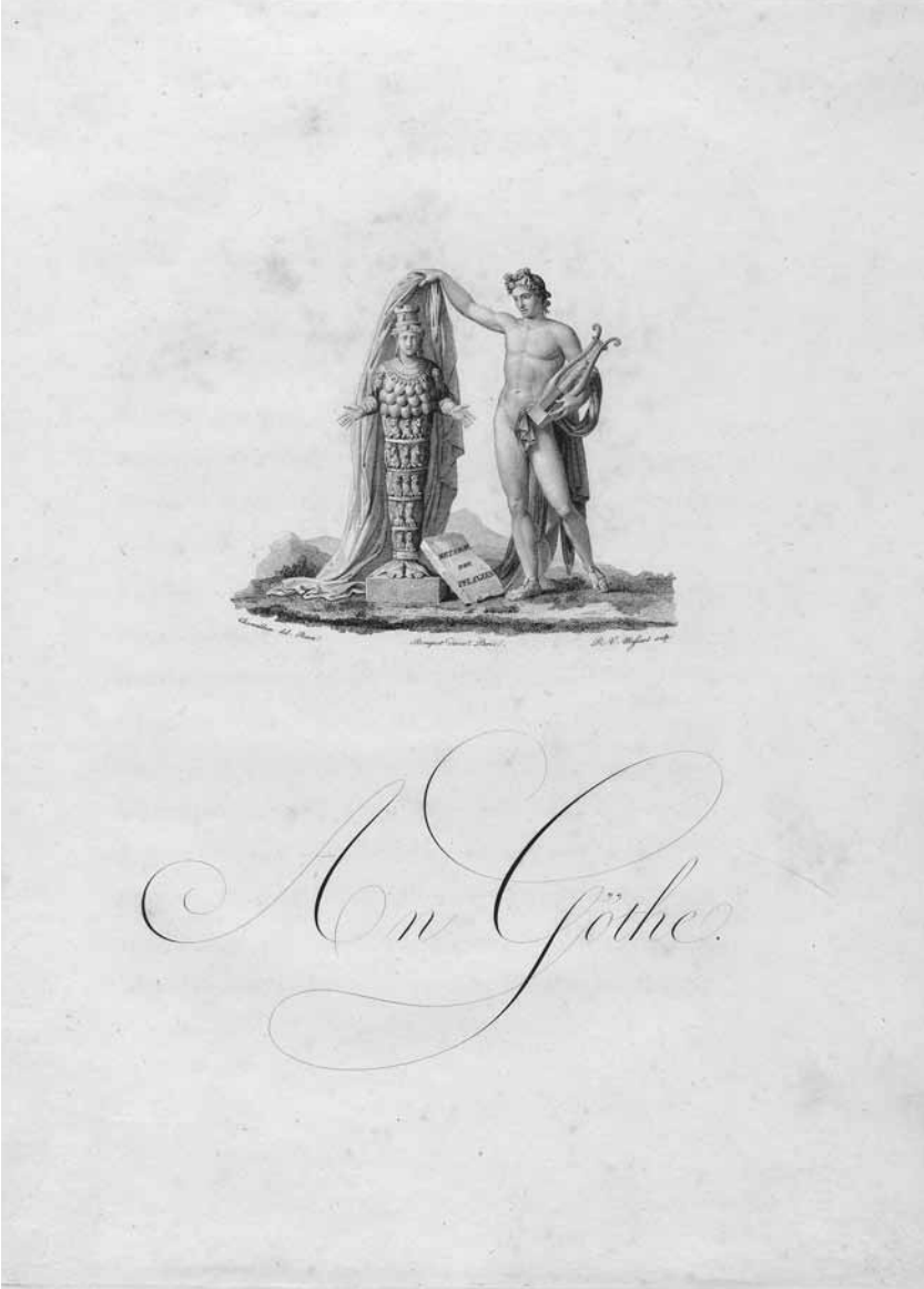
Frontispiece to the German translation of Alexander von Humboldt's Ideen zu einer Geographie der Pflanzen nebst ein Naturgemälde der Tropenländer (1807), after a drawing by Bertel Thorvaldsen. It shows a statue of Artemis of Ephesus being unveiled by Apollo.