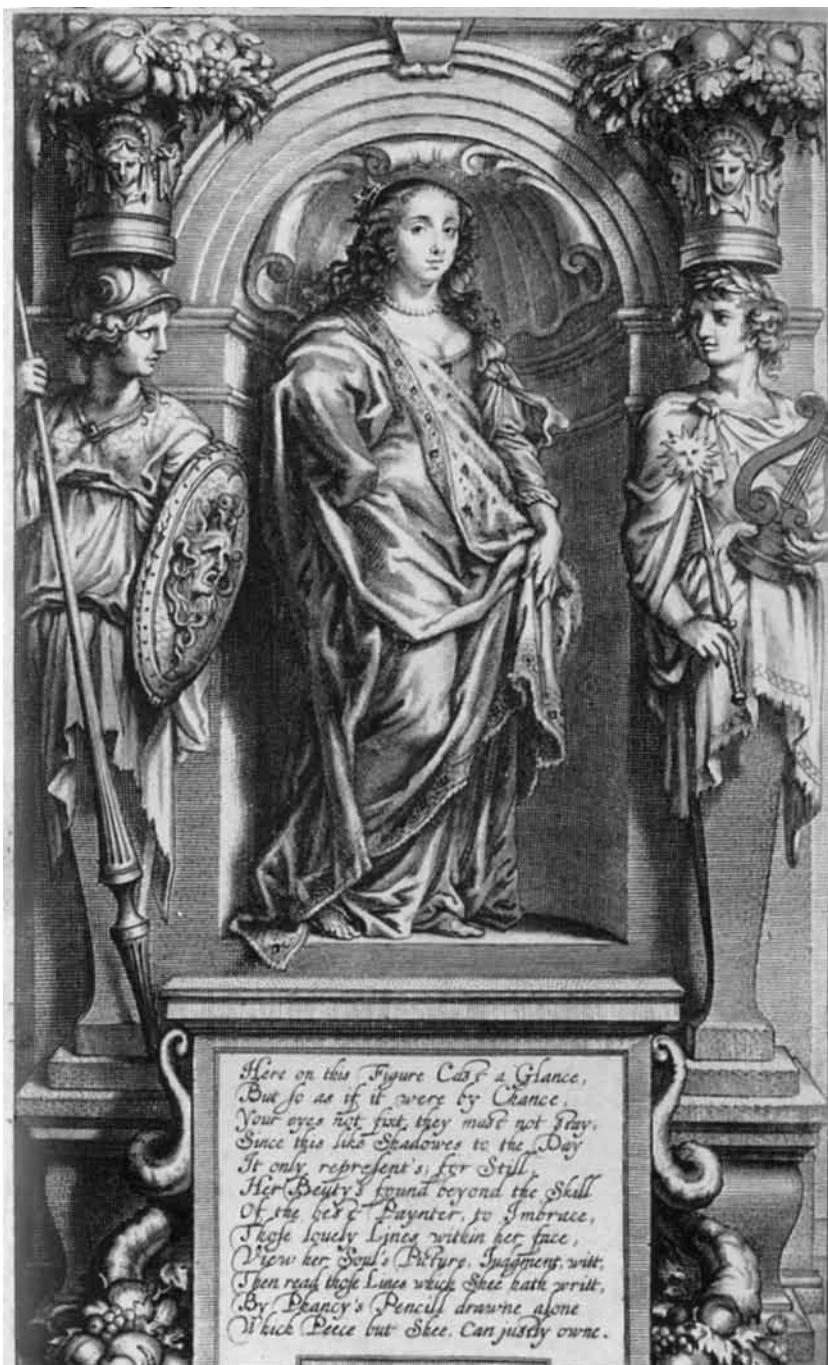
Fig. 1. Frontespis, framställd till Margaret Cavendishs verk av Abraham van Diepenbeek i Antwerpen, någon gång under 1650-talet.