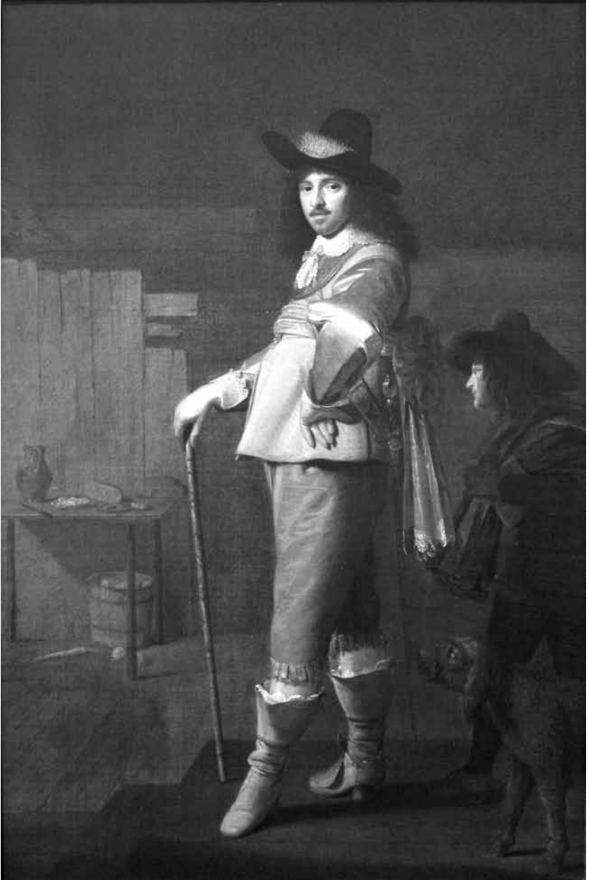
Fig. 4. Johannes Cornelisz Verspronck. Porträtt av Andries Stilte, 1640. Originalet finns på Columbus Museum of Art, Ohio.