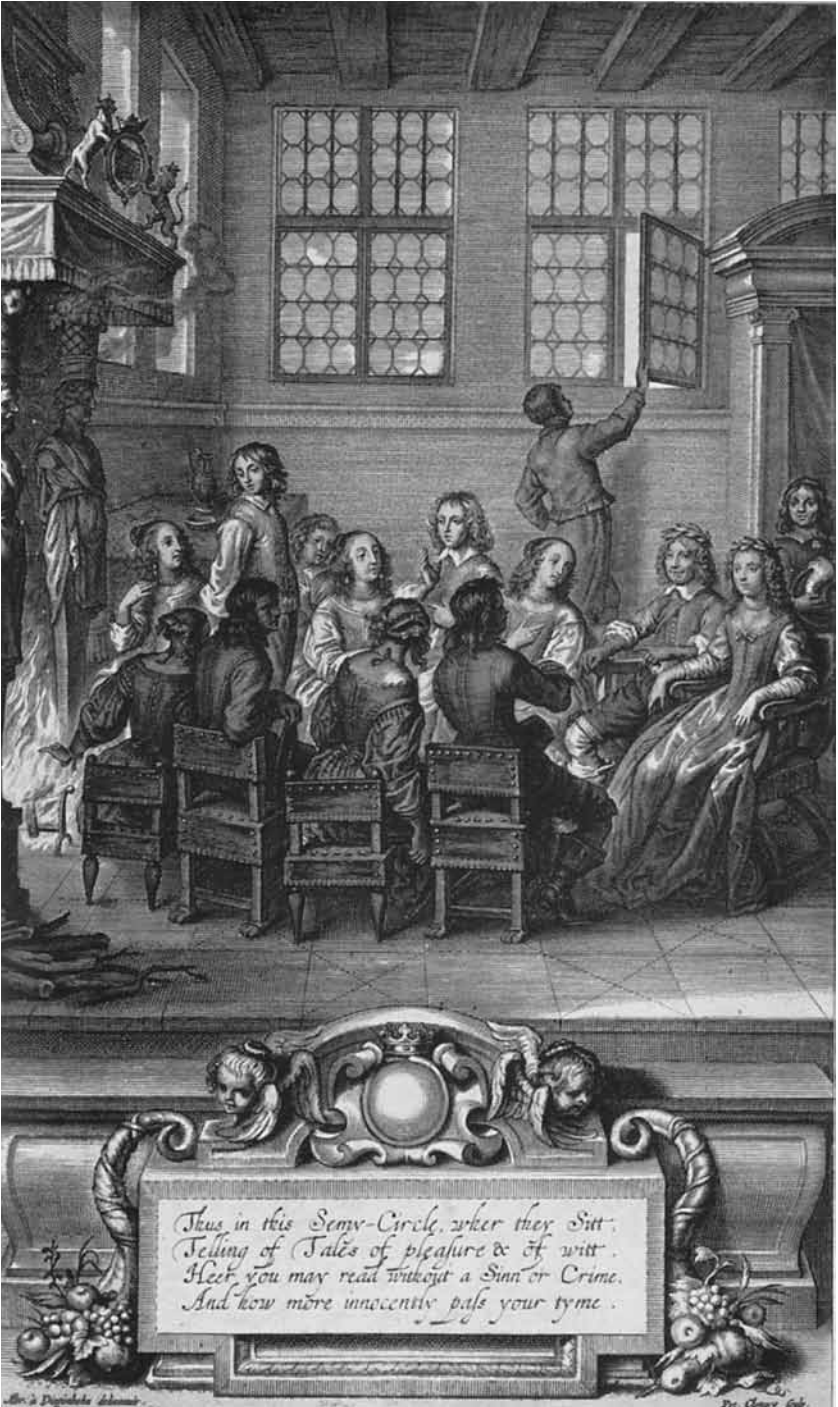
Fig. 3. Frontispis, framställd till Margaret Cavendishs verk av Abraham van Diepenbeek i Antwerpen, någon gång under 1650-talet. (Bild från Douglas Grants biografi Margaret the First , 1957).