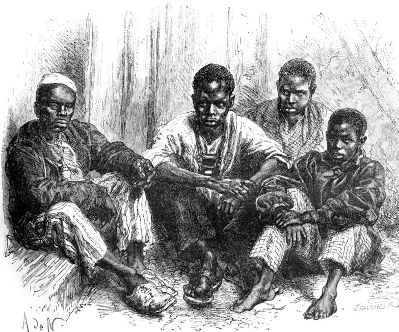
"Svart ras", teckning av A de Neuville efter fotografi, ur Onésime Reclus La terre à vol d'oiseau , 1893. I kontrast till den vite soldaten är de svarta männen sysslösa, deras ansikten uttrycker passivt missnöje. En av dem saknar skor. Bildkompositionen förmedlar en hierarki i den rasindelning Reclus ömsom angriper och ömsom använder.

tade typologier. Reclus talar inte om kroppsliga variationer, fokuserar inte på biologiska, fysiska skillnader. Den största skillnaden mellan bilderna ligger i kompositionen och de attribut människorna avbildas tillsammans med. I kontrast till detta står bildtexternas prosaiska "svart ras", "röd ras", "vit ras". Reclus rasbegrepp innebär på en gång ett inre ursprung manifesterat i en färg och något yttre, kulturellt, representerat i attribut och situationer.