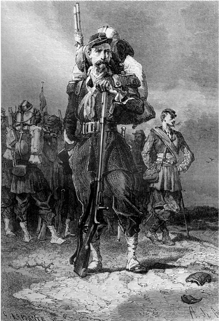
"Vit ras", teckning av A de Neuville ur Onésime Reclus La terre à vol d'oiseau , 1893. Den vita människan representeras av soldater i fält. Organiserad, modernt utrustad och framåtblickande utstrålar mannen i förgrunden aktivitet och mod.