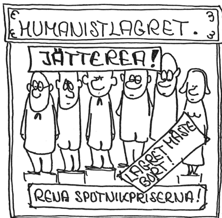
Teckning av Staffan Lindén, hämtad ur Teddy Brunius Handbok för humanister (Lindblads, 1963).

angelägna framtidsuppgifter men att den humanistiska forskningen behövde rustas. Under rådande omständigheter tycktes humanisternas initiativkraft hämmad. De kunde inte fullt utnyttja sin potential och med lika hög växel följa med i den storslagna framtidsresa som naturvetenskap och teknik anförde. För att skapa nya förutsättningar för humaniora efterfrågade Lönnroth därför ett organisatoriskt nytänkande. 30 Detta skulle ett år senare stå i centrum för den forskningspolitiska debatten om humaniora.